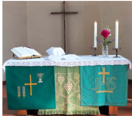
„Fusionsaltar“ (Juli 2013) mit den Paramenten der Altäre unserer drei Kirchen (Gütenbach, Furtwangen, Vöhrenbach)

Bis heute, in unser Christsein hinein, sind diese beiden Altäre sinngemäß vorhanden. Wobei unser Angenommensein vor Gott, dem HERRN schon von Jesus, dem Sohn Gottes am