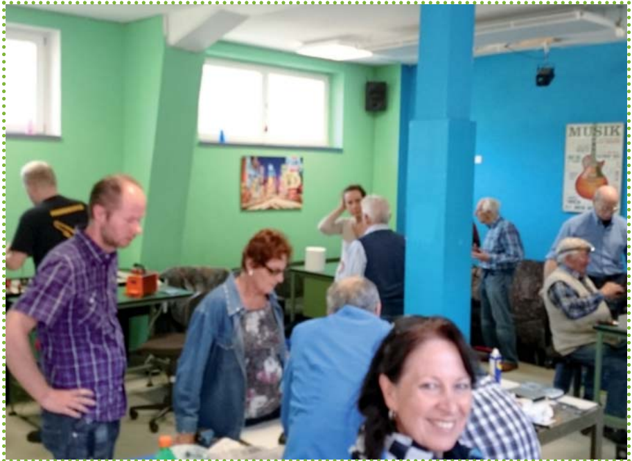
Schnapsschuss vom ersten Reparatur-Café am 21. Mai!