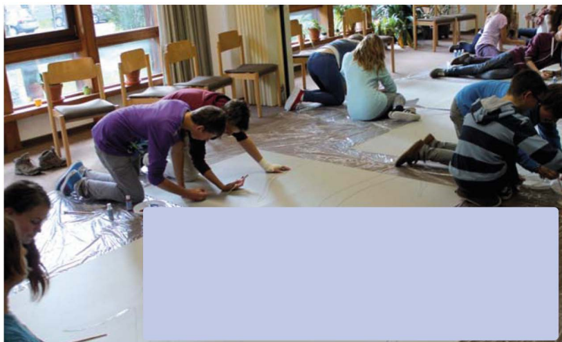
Aus der ersten Konfirmandenstunde: Die Gruppe gestaltet den Konfi-Baum für die Kirche.

UNSERE DIE SJÄHRIGEN KONFIRMANDINNEN UND KONFIRMANDEN