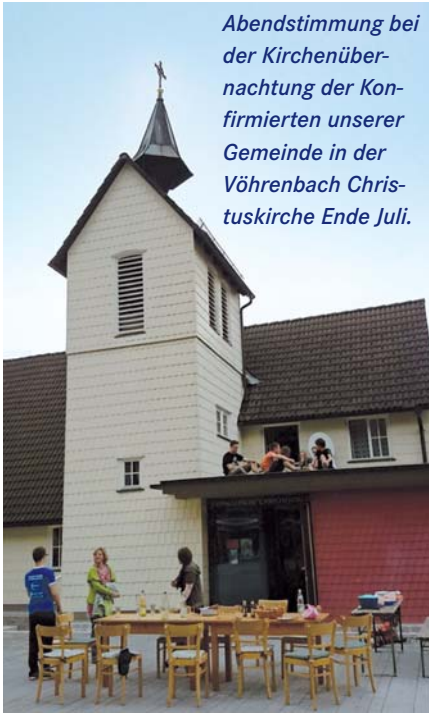
Abendstimmung bei der Kirchenübernachtung der Konfirmierten unserer Gemeinde in der Vöhrenbach Christuskirche Ende Juli.

Es begann am Freitag mit gemeinsamem Grillen, die rund zehn Jugendlichen erkundeten die Kirche und suchten sich Schlafplätze. Nach einem lustigen Film war die abenteuerliche Nachtaktion im finsternen Wald beim Bruderkirchle ein besonderes Highlight, eine Segensandacht – oder war es schon ein Morgengebet – in der nur durch Kerzen erleuchteten Kirche schloss den Tag ab. Morgens gab es einen Brunch und eine Abseilaktion am gegenüberliegenden Mühlenberg.