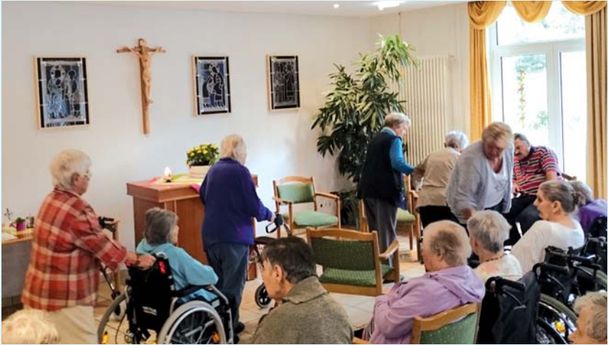
Vorbereitung zum allmonatlichen Gottesdienst im Vöhrenbacher Seniorenpflegeheim Sozialkonzept „Luisenhof“.